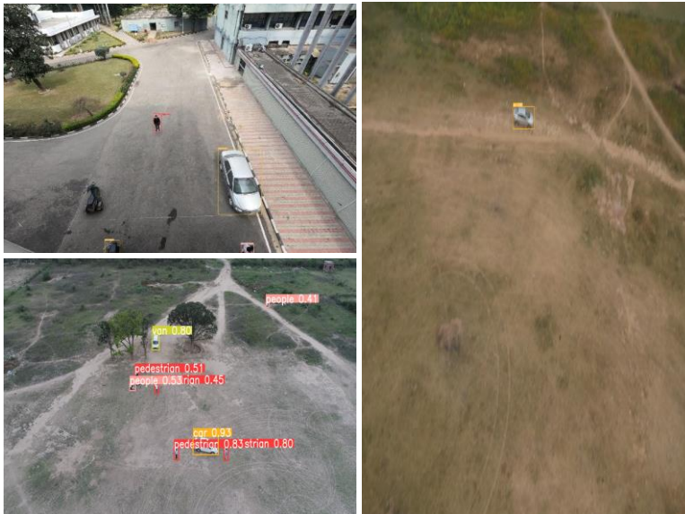
Test Cases and Object Detection Results